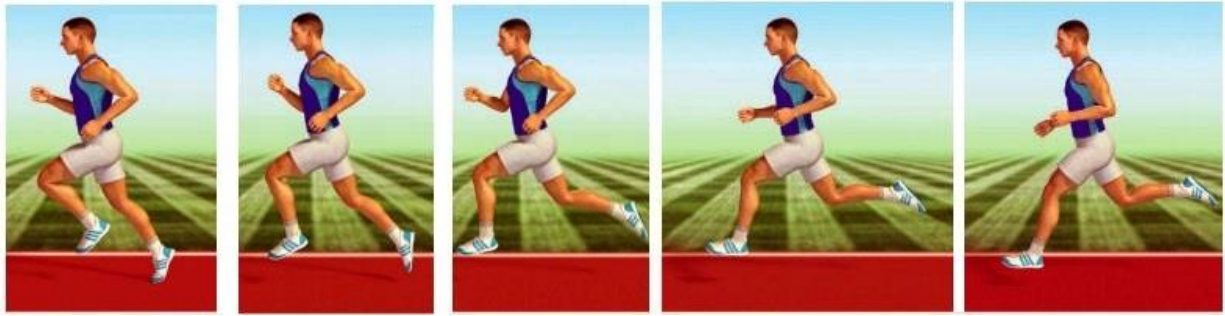
Рис. 4. Бег на 3 километра