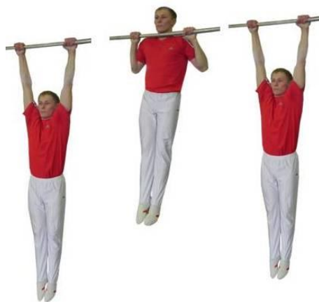
Рис. 1. Подтягивание на перекладине