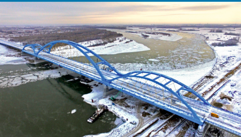
МОСТЫ И ДОРОГИ