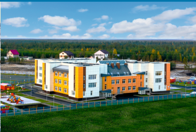
ЖИЛЫЕ ДОМА, ШКОЛЫ И ДЕТСКИЕ САДЫ